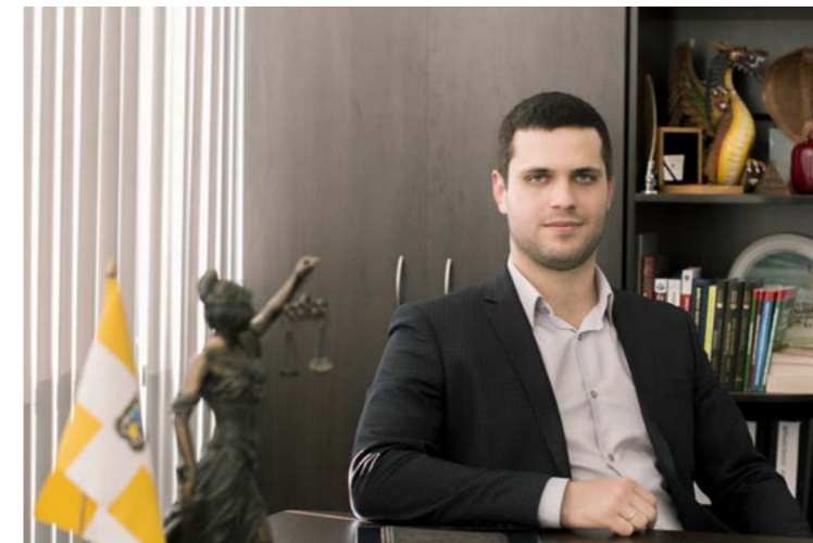
С уважением, А.П. Кувалдин. Ставропольский Арбитражный Третейский суд.

Вестник будет, безусловно, интересен как руководителям предприятий и организаций, их юридическим службам, так и юристам, занимающимся частной практикой.